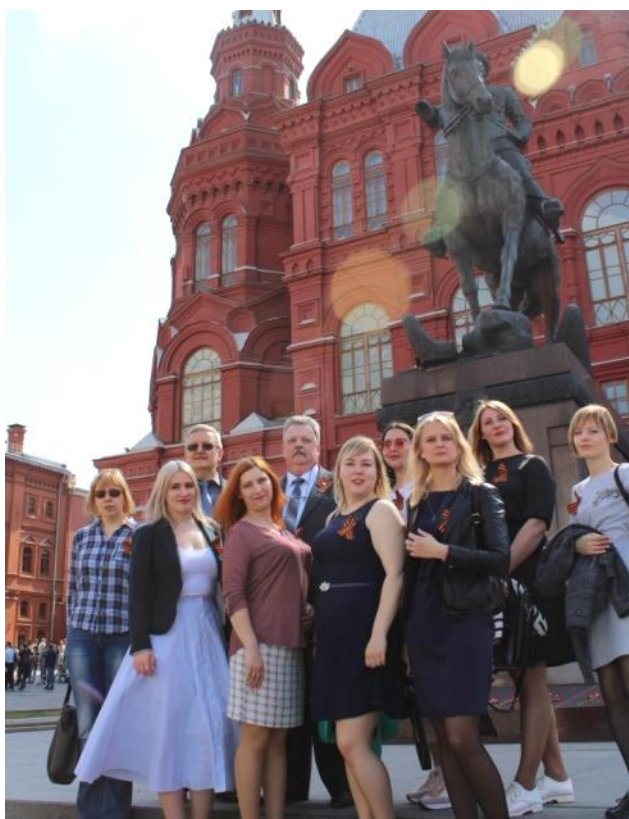
У памятника маршалу Жукову