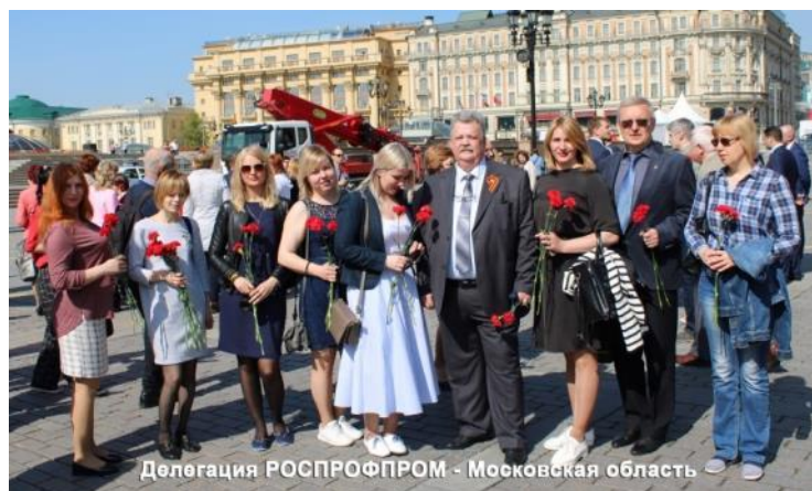
Делегация РОСПРОФПРОМ - Московская область