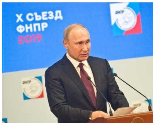
Выступление Президента РФ В.В. Путина