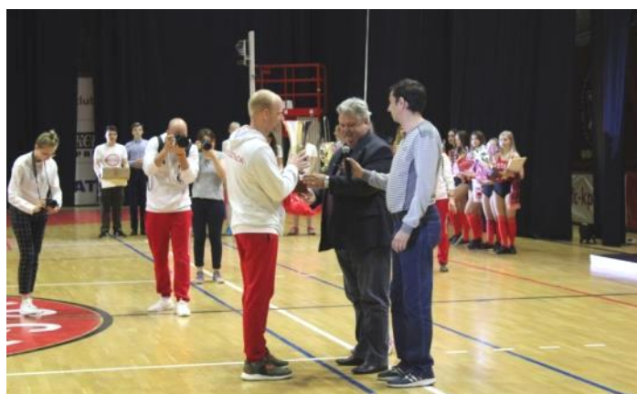
Вручение профсоюзного Кубка