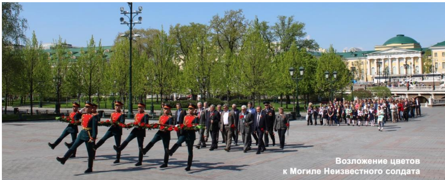
Возложение цветов к Могиле Неизвестного солдата