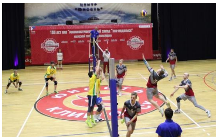
В атаке «ЗиО-Подольск»