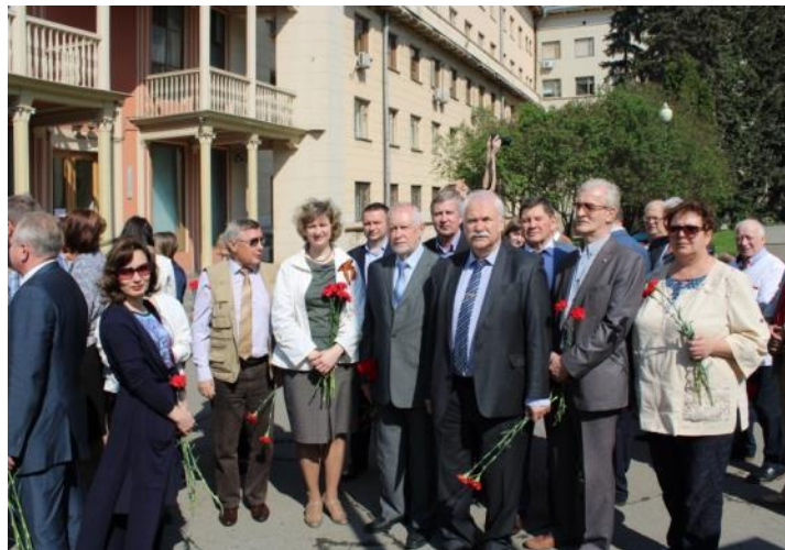
РОСПРОФПРОМ на церемонии возложения цветов 7 мая